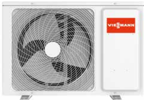
Vitoclima 300-Style: unità esterna