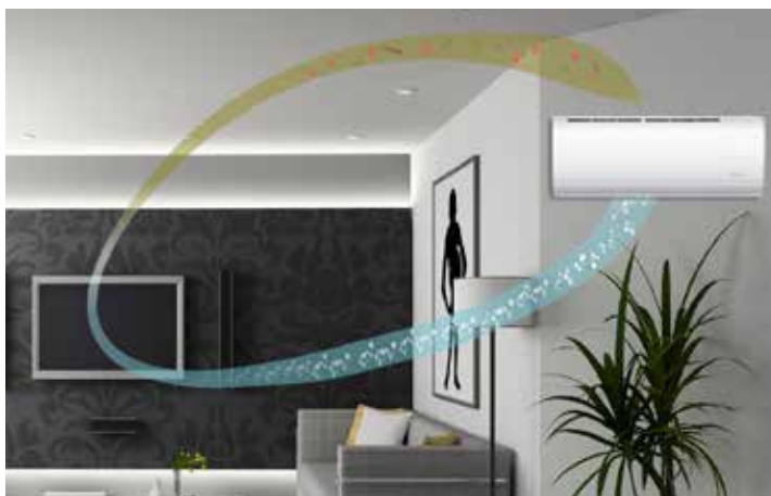
Principio di funzionamento del sistema di microfiltrazione e purificazione IFD del Vitoclima 300-Style