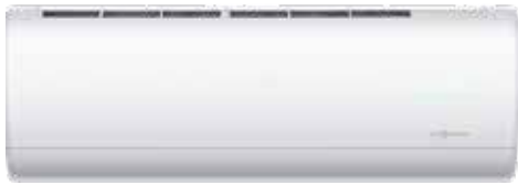
Vitoclima 300-Style: unità interna